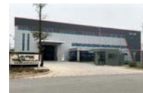
Laymac Vietnam CO.,LTD