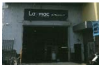
株式会社 レイマック

レイマックは日本の技術が密集しているものづくりの街、東大阪にある会社です。ベトナム工場も稼働しており、日本のものづくりの技術を活かし高品質の製品をご提供。ベトナムの発展に貢献できることを目指しています。